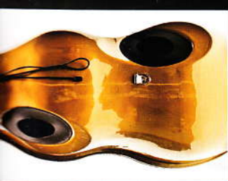
EISER AM SAX SAX ONE 2.0 DÄMPFER