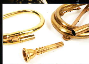
KLAPPENTROMPETEN HISTORISCHE KLANGWELT